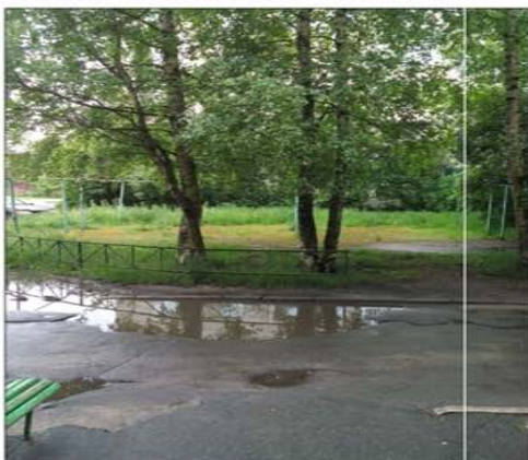
фактическая разворотная площадка (ул.Ленинградская)