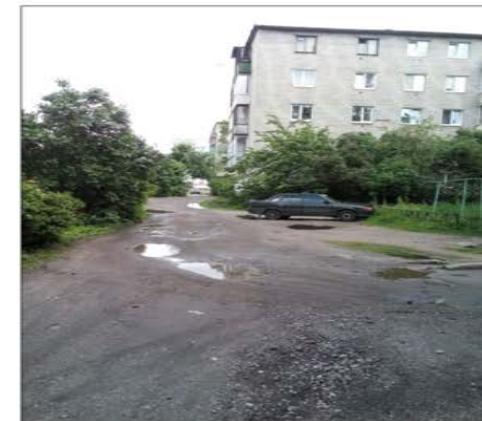
фактическая хозяйственная площадка