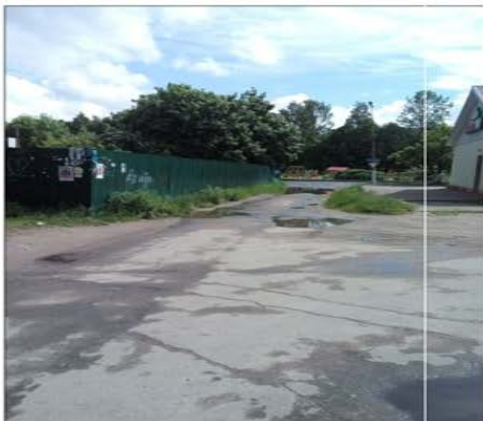
проезд и фактическая парковка