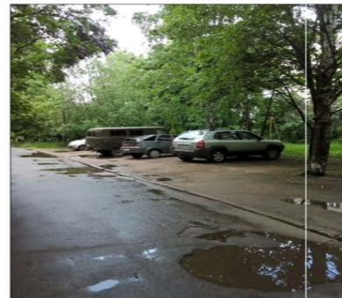
ул. Ленинградская и фактическая парковка