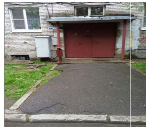
выезд со двора на ул.Ленинградскую