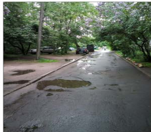
проезд и фактическая парковка